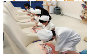
小牙医练习正确的刷牙方法