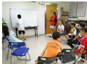
绘画心中的科学家