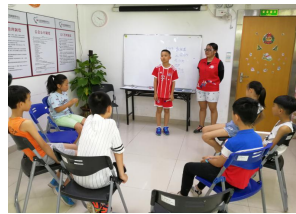
社工和组员自我介绍

本次小组旨在通过学习科学知识、体验科学实验，激发社区青少年学习科学、探索科学的兴趣，提高动手能力，培养科学家品质和精神。