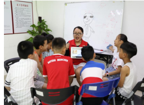
组员聆听科学家的故事