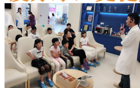
小牙医学习牙齿基础知识