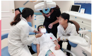
医生为小牙医检查牙齿